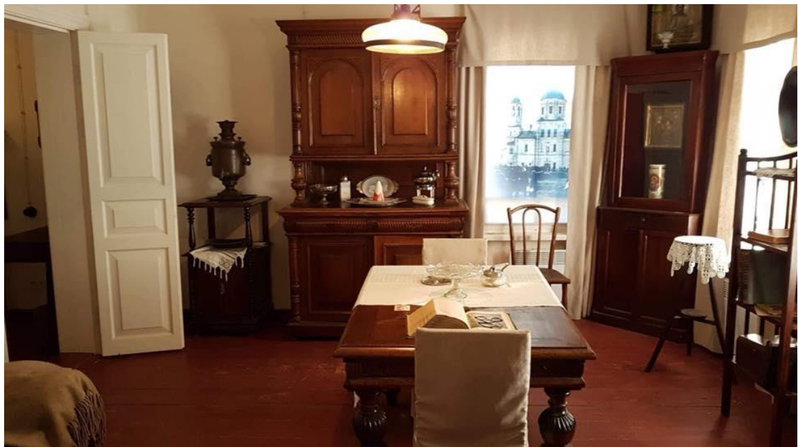
Комната, в которой с 1943 по 1946 годы проживал святитель Лука.

После открытия бюста последовала презентация мемориальной музейной экспозиции «Келья архиепископа Луки», которая создана в доме, где жил святитель.