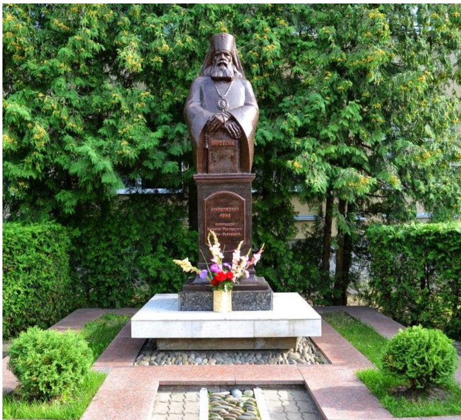
Памятник святителю Луке, скульптор — Г. Юсупов.

В нашем городе памятник хирургу-священнику воздвигнут у больницы, которой присвоено его имя в 1994 году.