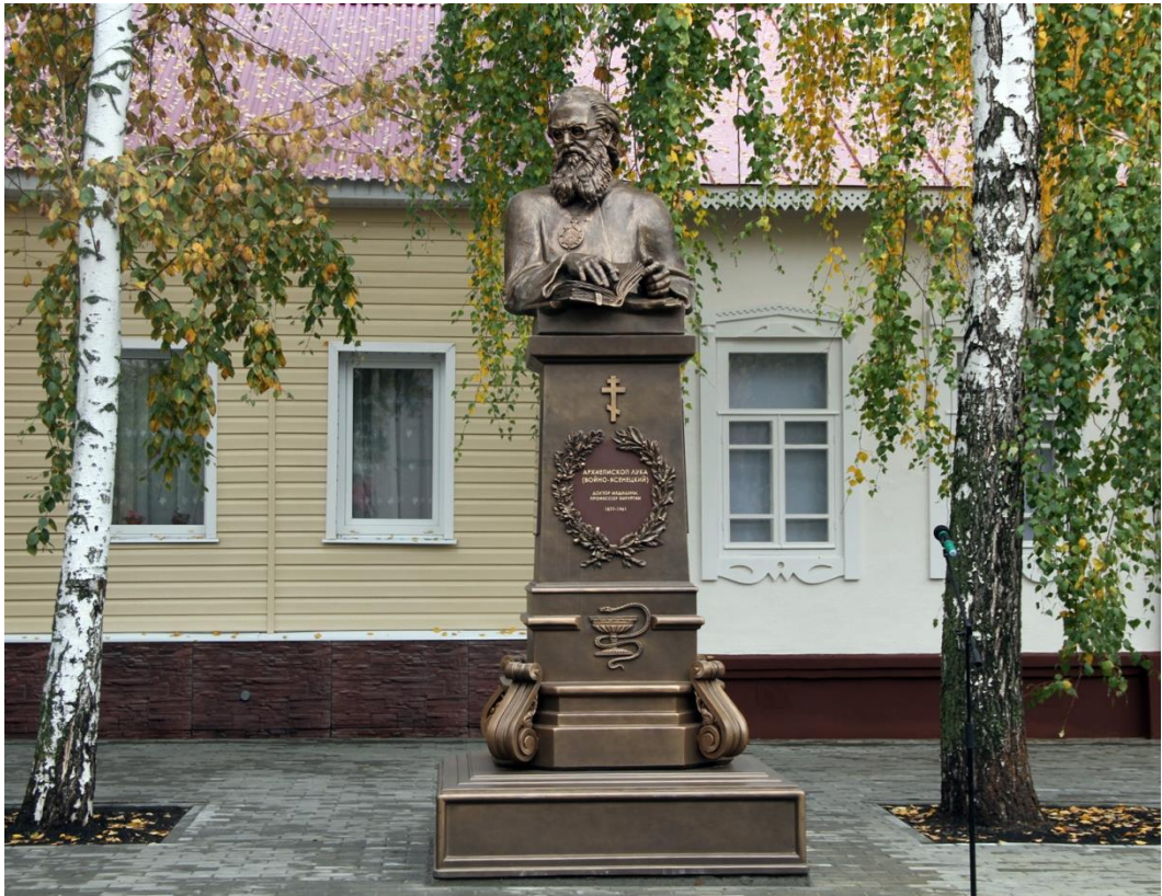
памятник святителю Луке на улице Комсомольской г. Тамбова

После открытия бюста последовала презентация мемориальной музейной экспозиции «Келья архиепископа Луки», которая создана в доме, где жил святитель.