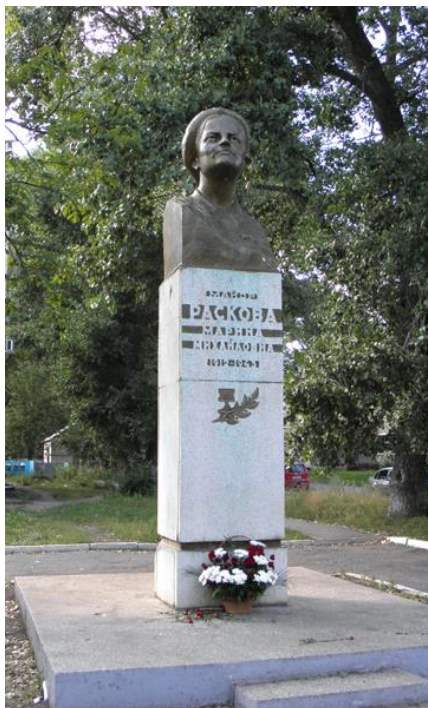
Памятник Расковой М.М.

На территории Лётного военного городка перед входом в бывшее Тамбовское военное училище летчиков в 1970 году установлен памятник Расковой Марине Михайловне, скульптор В.Сонов.