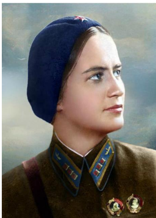
Раскова Марина Михайловна