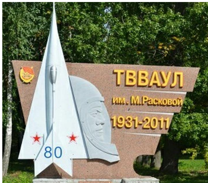
Стела установлена к 80-летию Тамбовского ВВАУЛ им. М. Расковой

Училище было расформировано в 2009 году. В настоящее время здесь расположена школа-интернат с первоначальной лётной подготовкой. Каждые пять лет в бывшем лётном училище проходят встречи выпускников. Встречи однокурсников по традиции начинаются с торжественного построения на плацу училища. В честь 80-летнего юбилея была установлена памятная стела на средства выпускников училища при финансовой поддержке администрации Тамбовской области в 2011 году.