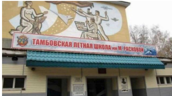
Вход в бывшее ТВВАУЛ

В память об отважной летчице ее именем названы: 125-й Гвардейский бомбардировочный полк. Улицы в городах нашей страны. Ее имя носили и два судна. Так же именем Марины Расковой названо бывшее Тамбовское высшее военное авиационное училище.