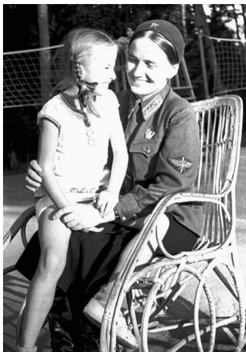
Раскова М.М. с дочерью 1938 год.