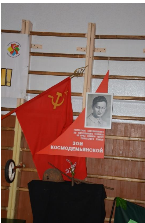
Инсталляция на городских соревнованиях по настольному теннису среди подростковых клубов города Тамбова, посвященных памяти героя Советского Союза Зои Космодемьянской

Ребята из подросткового клуба «Орфей» с особенным трепетом относятся к сохранению памяти о подвиге героини своего музея. Они подготовили фото репортаж о посещении памятных мест города Тамбова, связанных с именем Зои Космодемьянской и посвятили ей свои работы в творческом конкурсе «Помни имя своё», а, представленная командой из «Орфея», литературно-музыкальная композиция о подвиге нашей землячки Зои Космодемьянской, стала победителем городского конкурса подростковых клубов «Созвездие талантов».