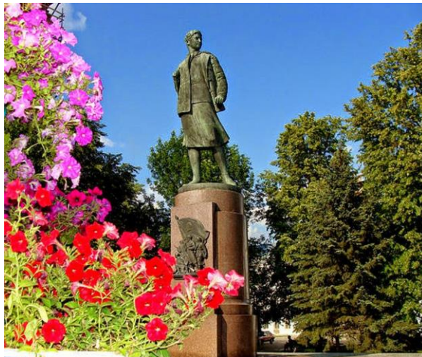
Памятник Космодемьянской З.А.

В 1947 году в самом центре Тамбова на большой площади, рядом с которой в последующем был разбит одноименный сквер открылся памятник Зое. В 1960 году этому памятнику присвоен статус объекта культурного наследия федерального значения. Скульптором данного памятника является М.Г. Манизер, а архитектором выступил И.Г. Лангбард.