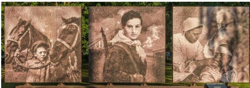
Художественное панно-триптих. Автор Игорь Пишеницын.

В 2015 году в парке 40-летия Победы города Тамбова открылся мемориал-триптих, посвященный 70-летию Победы и памяти Бессмертного полка. Этот триптих венчает собой огромную работу по увековечению подвига наших земляков во время войны.