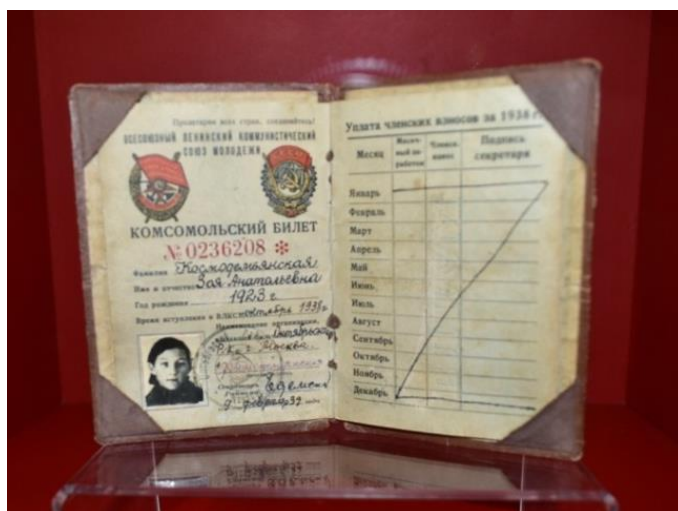
Комсомольский билет Космодемьянской З.А.

«Граждане! Не стойте, не смотрите. Надо помогать воевать Красной Армии, а за мою смерть наши товарищи отомстят немецким фашистам. Советский Союз непобедим и не будет побеждён».