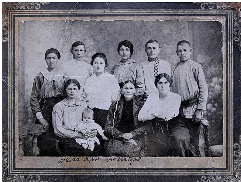
Семья Мордасовых (фотокопия)