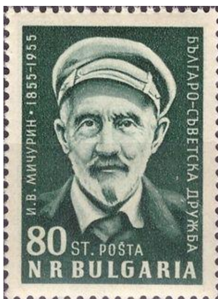
Почтовая марка Болгарии с изображением Мичурина И.В.