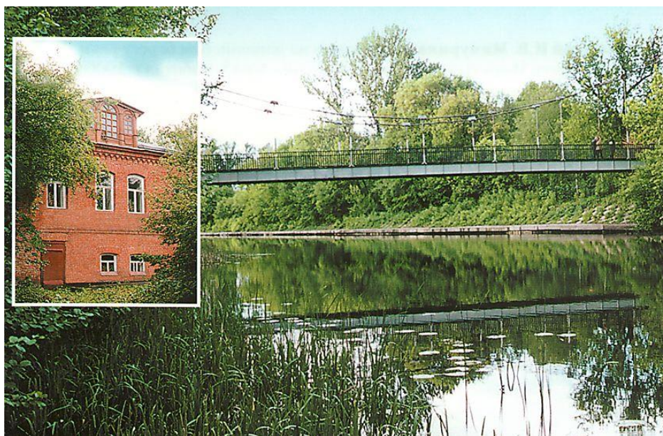
Мост к дому-музею Мичурина И.В.

В живописной местности на левом берегу реки Лесной Воронеж расположен Основной питомник и Дом-музей И.В. Мичурина, к которому из города ведет шоссе, окаймленное тенистой аллеей из тополя, клена, ясеня, рябины, яблони. Через реку Лесной Воронеж перемахнул металлический подвесной мост.