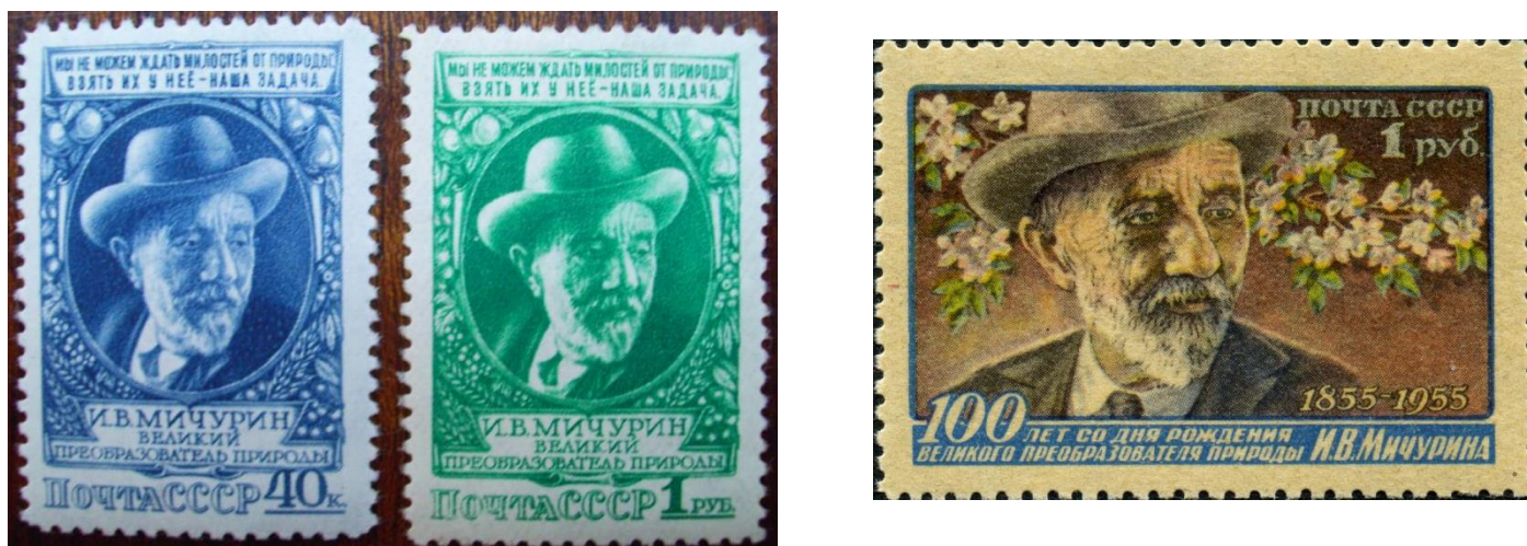
Почтовые марки СССР с изображением Мичурина И.В.

Иван Владимирович изображен на почтовых марках СССР и почтовой марке Болгарии 1955 года.