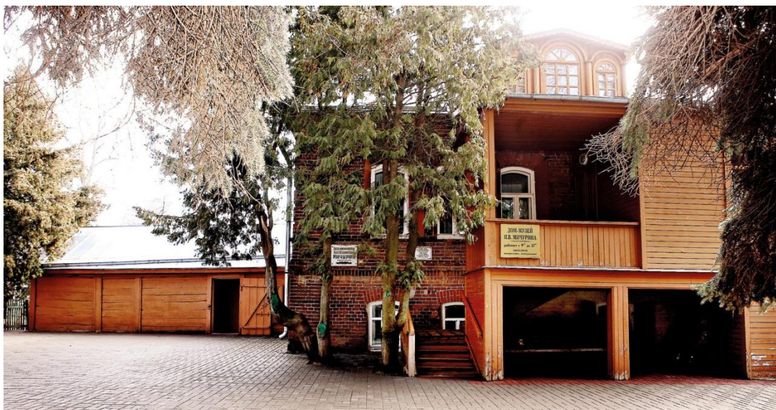
дом –музей Мичурина И.В. в Мичуринске