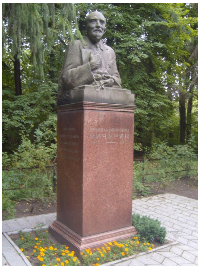
Бюст Мичурину И.В. в основном питомнике г. Мичуринск

За пилонами, в зелени елей, туй, лип, жимолости, среди яркого ковра роз, лилий, тюльпанов и множества других цветущих и благоухающих растений — памятник И.В. Мичурину. Массивный бюст естествоиспытателя, высеченный из цельного серого гранита. В правой руке, прижатой к груди, книга — символ его теории о преобразовании природы. Левая рука придерживает грудку плодов — символ изобилия. По правую сторону от памятника начинаются экспериментальные участки общей площадью около 170 гектаров.