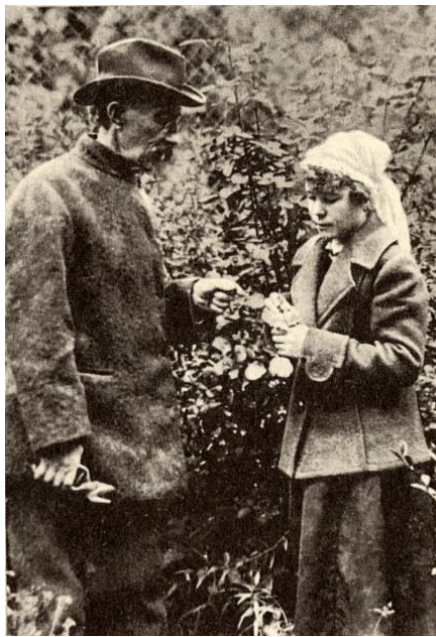
Мичурин И.В. с женой