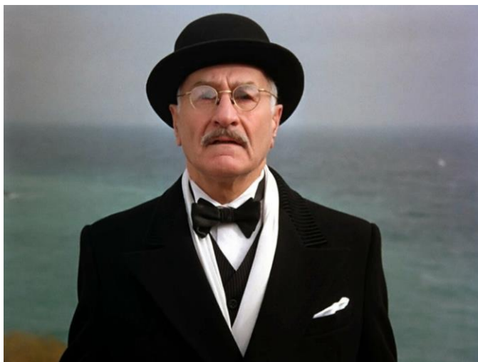
Зельдин В.М. в роли судьи в художественном фильме «Десять негрят»

В 80-е Зельдин сыграл Фредерика Фэрли в мелодраме «Женщина в белом», комиссара в детективе «Тайна «Чёрных дроздов», судью в психологическом детективе «Десять негрят».