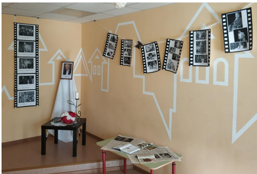
Музейный уголок Зельдина В.М. в подростковом клубе «Романтики»

Музейный уголок, посвященный этому известному актеру, расположен в подростковом клубе «Романтики» по адресу: г. Тамбов, Ул. Ивана Франко, д. 20.