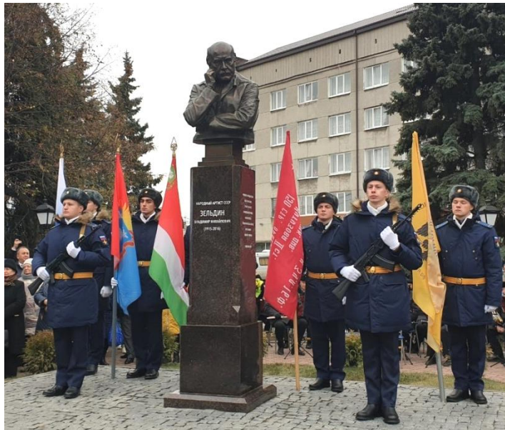
Памятник Зельдину В.М в городе Мичуринске Тамбовской области в сквере на улице Революционной