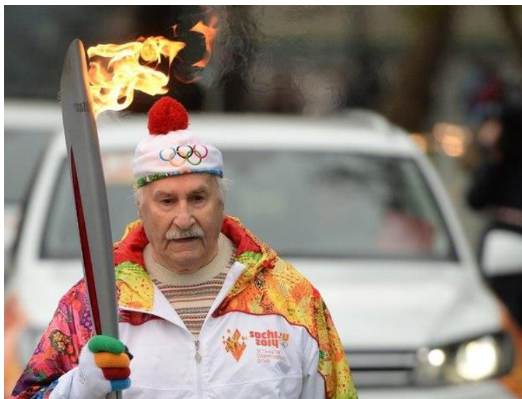
Национальный этап эстафеты Олимпийского огня