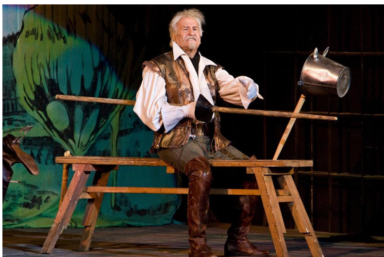
Роль Дон Кихота в спектакле «Человек из Ламанчи» в исполнении Зельдина В.М.

К 90-летию Юлий Гусман подготовил новую роль для Владимира Михайловича — это роль Дон Кихота в знаменитом мюзикле «Человек из Ламанчи», где актер мастерски пел, танцевал, играл в драматических сценах.