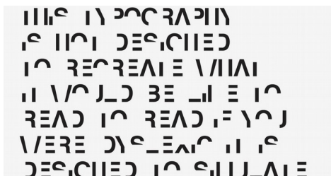
Так видит текст дисграфик

ребенок читает слово неправильно («шалко» вместо «жалко»); допускает искажения звуко-слоговой структуры слова («анулицу» вместо «на улицу»); ребенок не ориентируется на листе, не видит строчки и клеточки); «угадывающее» чтение» (ребенок прочитывает начало слова, а потом «подставляет» неправильное окончание).